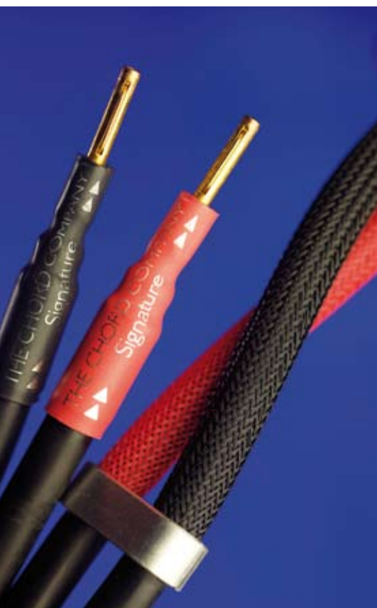
Pris: NOK ca 10500,- (2x2,5 meter) (-for tiden 30% rabatt) Importør: Norsk Hi-Fi Center